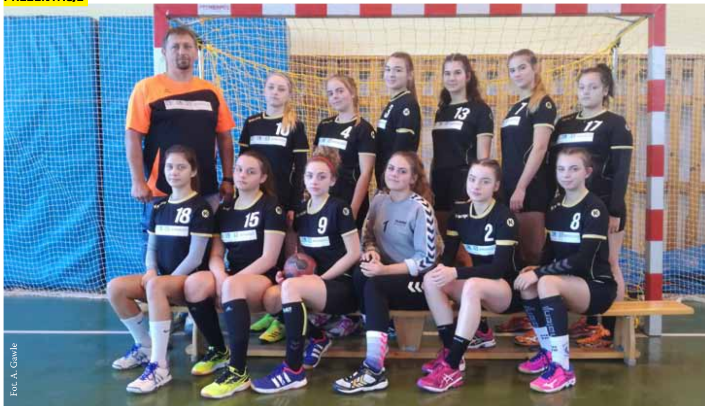
Fot. A. Gawle