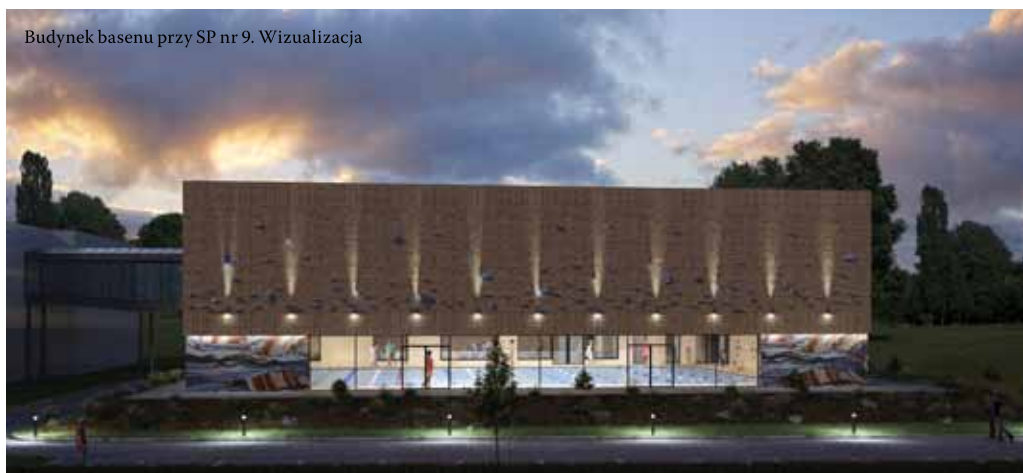
Budynek basenu przy SP nr 9. Wizualizacja